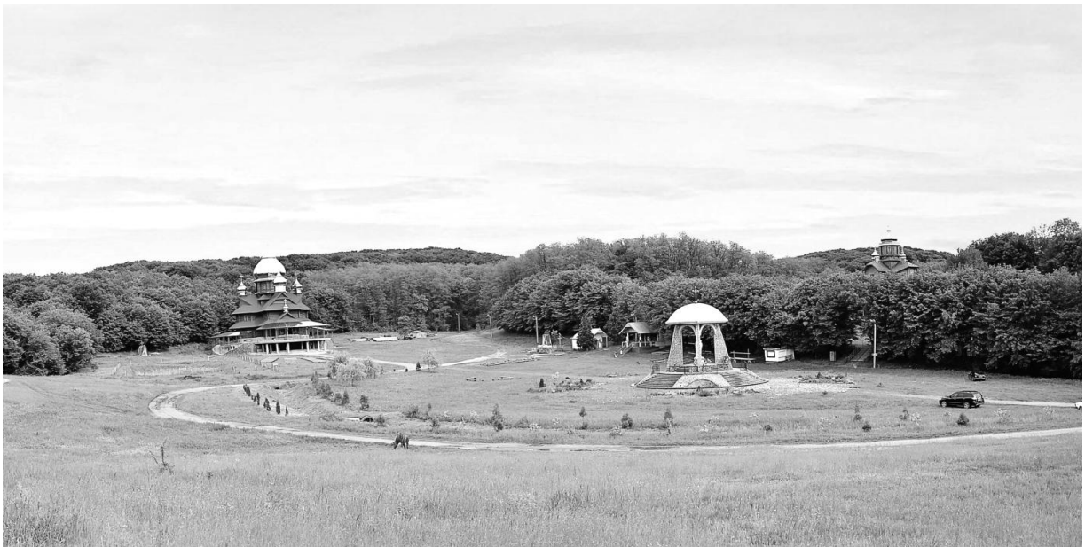
Рис. 1. Паломницький центр у с. Погоня, 2016 рік

Будівництво нової церкви та монастирських приміщень розпочалось ще перед Першою світовою війною, а завершилось вже перед Другою. За часів Радянської влади монастирські келії використовувались під господарські потреби. Один із корпусів монастиря використовувався як психоневрологічний інтернат, який існує дотепер.