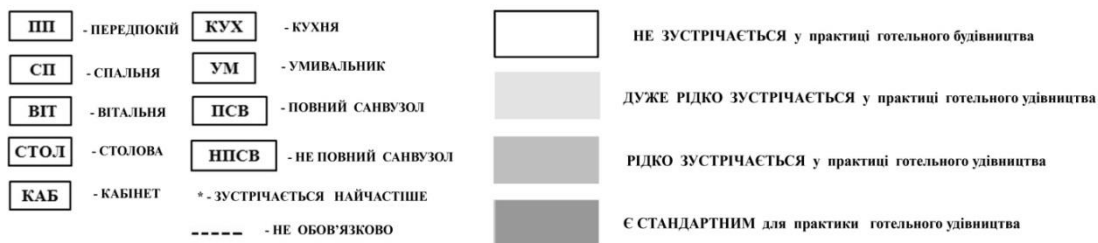
Рис. 5. Типи готельних номерів за рівнем комфортності