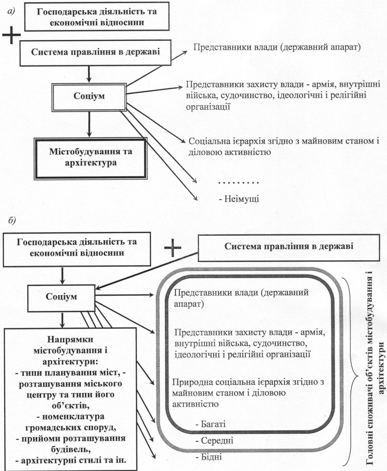
Рис. 1. Вплив господарської діяльності та системи правління на містобудування і архітектуру (Світова система): а – схема впливу за світовою системою; б – верстви населення, для яких зводять об'єкти архітектури і містобудування в першу чергу.