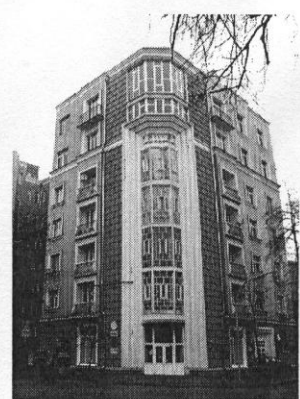
Рис.3. Архітектура житлових будинків України в 1920х – на початку 1940-х років (в радянський період будівництва соціалізму)