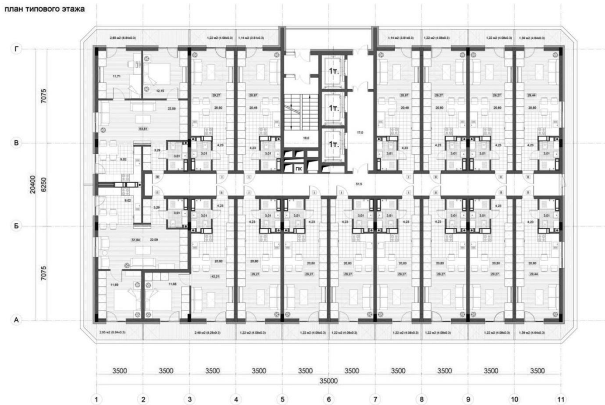
Рис. 4. План типового поверху апартаментів.