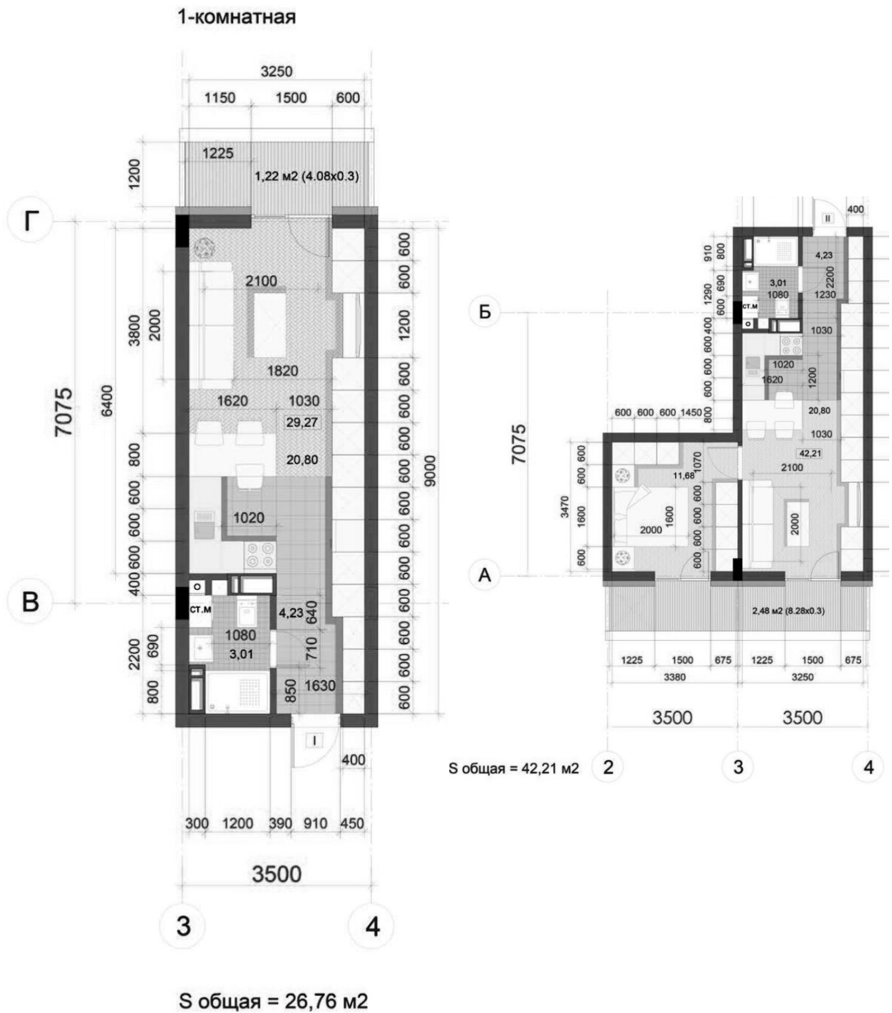
Рис. 6. Приклади планування одно-двокімнатного трикімнатного апартаментів.