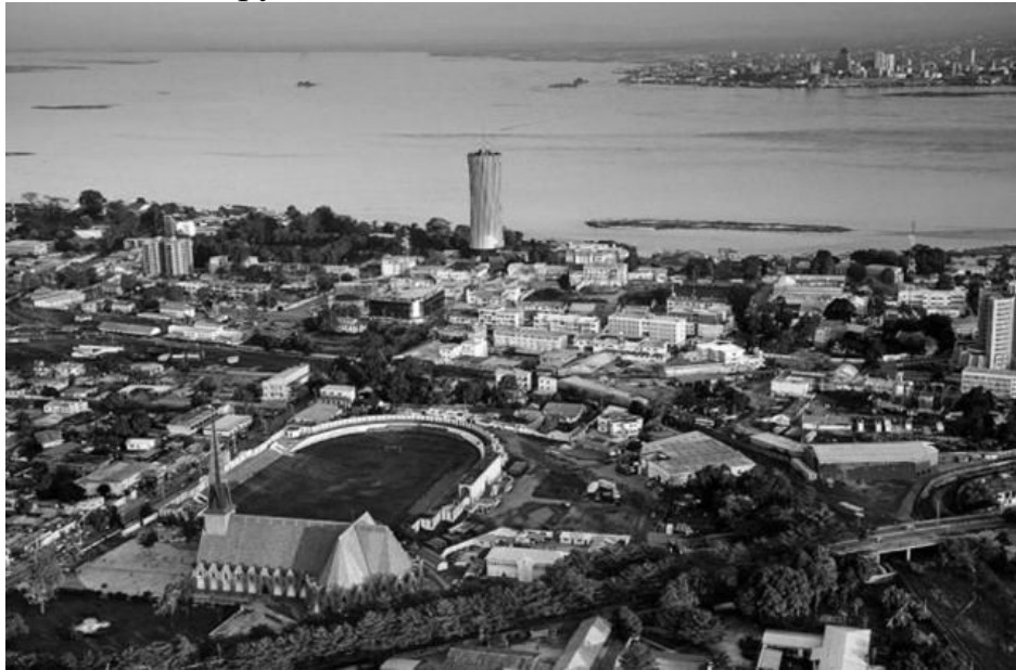
Рис. 1 Столиця Республіки Конго Браззавіль

висоті 230 метрів над рівнем моря. Народи Конго мають багаті культурні традиції - музичні, танцювальні та художні. Повсюдно збереглися такі ремесла, як різьблення по дереву, коски, плетіння кошиків. Особливий інтерес представляють дерев'яна скульптура і маски з відмітними особливостями кожної етнічної групи.