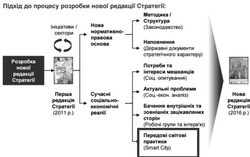
Рис. 2. Блок-схема підходу до розробки нової Стратегії розвитку міста Києва до 2025 року, за [5].

В світі положень Стратегії КМДА планується розробка цільової Програми відновлення водних об'єктів міста, що має відповідати вимогам Водної Рамкової Директиви Європейського Союзу [6].