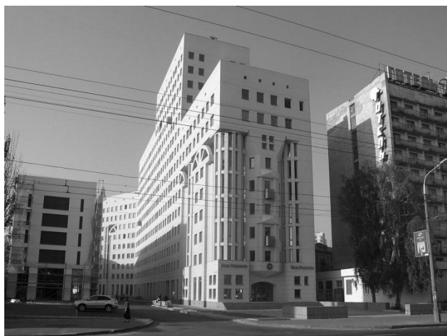
Рис. 2. ЖБ «Будинок крейніна» Арх. О. Дольнік, 2005 р.