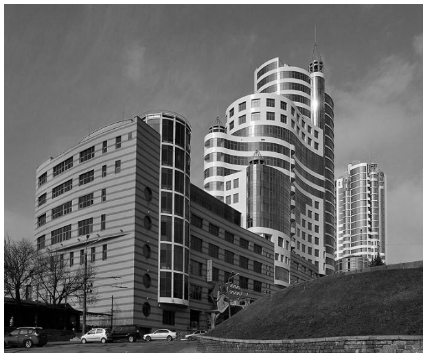
Рис. 4. ЖК «Славія-Магнат». Арх. М. Хохлов, 2010 р.