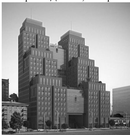
Рис. 5. ЖК «Union». Арх. бюро «Yunakov architects».