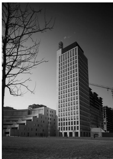
Рис. 1. ЖБ «Компаніла» Арх. О. Дольнік, 2007 р.

Таким чином, постмодерністичне направлення в архітектурі України, крім історизму, представлено неораціоналістичною течією. Архітектори, відмовившись від прямого запозичення, на основі європейського неораціоналізму, сформували власні стильові концепції. Неораціоналістичні тенденції стали провідними в формуванні сучасних житлових ансамблів в Дніпропетровську, а також вплинули на творчість київських архітекторів. Можна додати, що архітектурі неораціоналізму в Україні властивий підхід, коли морфологічно визначена концепція формує архітектурний образ, що загалом характерно для архітектури постмодернізму. Виходячи із відповідності архітектури неораціоналізму кліматичним, естетичним та іншим регіональним вимогам, можна прогнозувати розвиток цього стилістичного направлення в Україні.