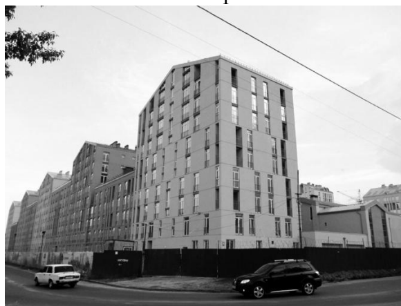
Рис. 6. ЖК «Комфорт таун». Арх. бюро «Архіматика», 2014 р.