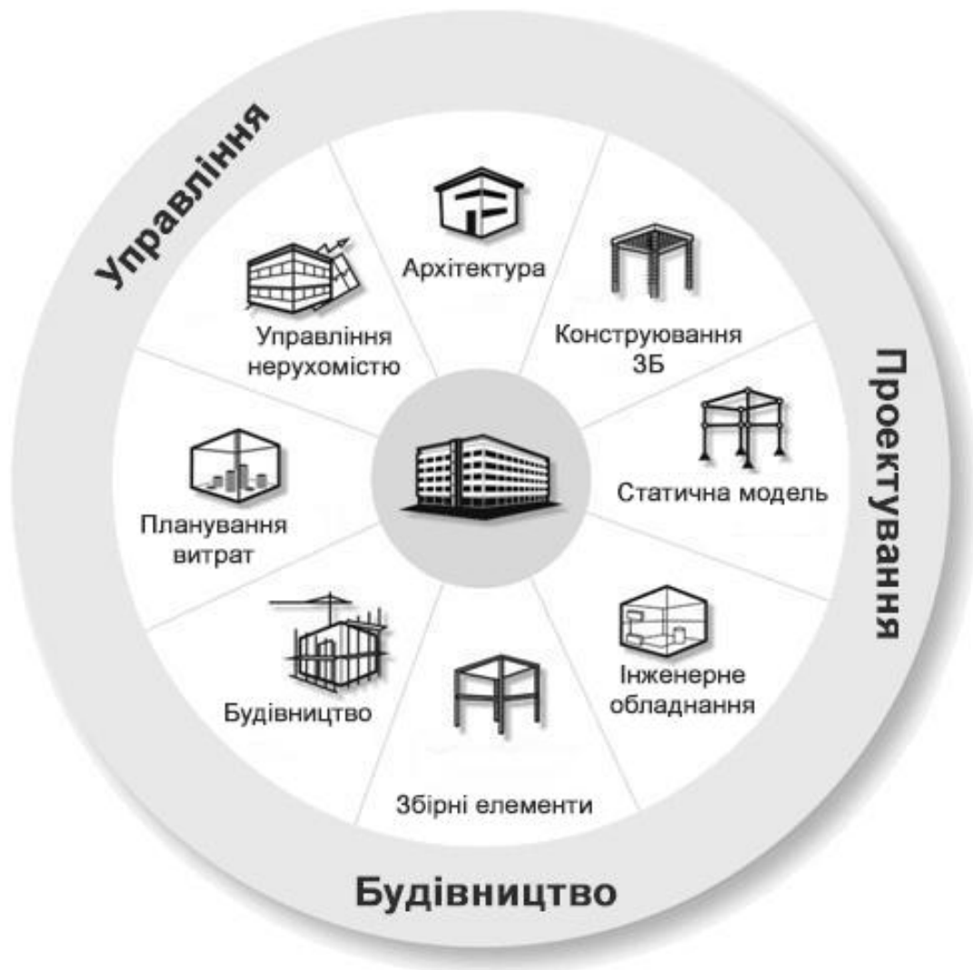
BIM середовище. [6]

Крім того, сама структура проекту в формі ієрархічного дерева папок є складовою частиною моделі.