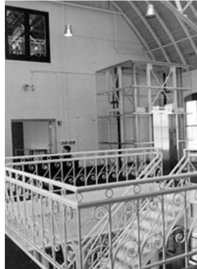
Рис. 10. Ліфт, виконаний в умисне контрастному стилі, монастир Erlenbad Sasbach. Німеччина