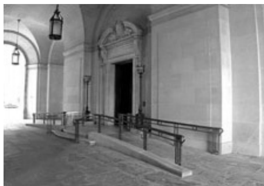
Рис.4.Пандус. William Jefferson Clinton complex. Вашингтон, округ Колумбія. США

Ліфти є найбільш зручним засобом вертикального переміщення, який задовольняє потреби переміщення усіх категорій маломобільних груп населення, але в той же час їх встановлення в пам'ятках архітектури потребує ретельної уваги, тому як вони досить великі за габаритом, потребують допоміжних приміщень (тамбури, ліфтові шахти), мають певний ряд вимог з питань евакуації і, як сучасний технічний пристрій, не завжди поєднується з історичним середовищем. Але тим не менш, багато історичних будівель вже облаштовані цим засобом переміщенням. Частіше ліфти розміщують в найменш уразливих частинах будівель і споруд, наприклад, біля другорядних сходових