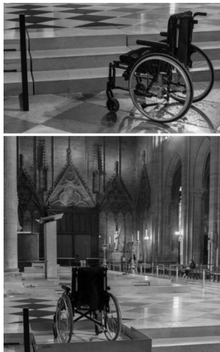
Рис. 12. Висувний підйомник, виконаний «під» матеріал будівлі. Нотр-дам де Парі, Франція

– похилі підйомники, прості і безпечні у використанні навіть при підйомі або спуску зі сходів без сторонньої допомоги, можуть монтуватися і всередині приміщення і назовні. Кріпляться на несучих стінах або на спеціальних стойках (рис. 14).