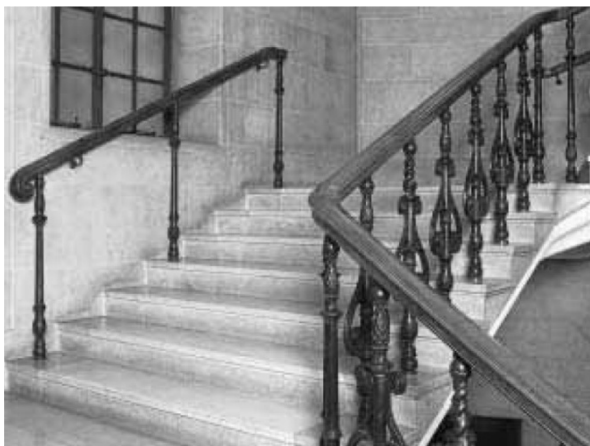
Рис.1.Додатковий поручень. Bank of England. Великобританія