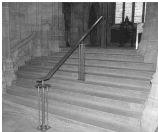
Рис.2.Розділовий поручень. John Rylands Library. Манчестер, Великобританія

Пандуси є найбільш поширеним елементом адаптації пам'яток архітектури, тому як можуть використовуватись як інвалідами на візках, так і людьми похилого віку та відвідувачами з дитячими колясками. До того ж, пандуси досить легко поєднуються з історичним контекстом споруди, тому як бувають різних конфігурацій (прямі (Рис. 3), поворотні (Рис. 4), криволінійні) та можуть бути виконані з різних матеріалів (дерево, метал, камінь(Рис. 5), тощо), але зазвичай їх виконують з матеріалів, які відповідають стилю пам'ятки. Там, де влаштування постійного пандусу неможливе влаштовують знімні (Рис. 6) або портативні (Рис. 7) пандуси.