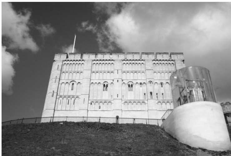
Рис.8. Ліфт, винесений за межі споруди. Нориджський замок. Великобританія