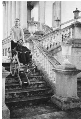
Рис. 13. Автономний мобільний сходовий підйомник на гусеничному ході