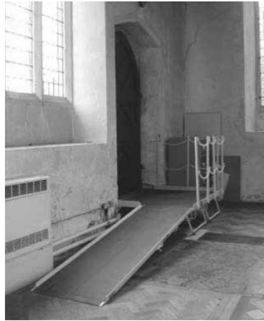
Рис.6. Знімний пандус в церкві Сент-Джеймс. Колчестер, портативного пандусу Великобританія