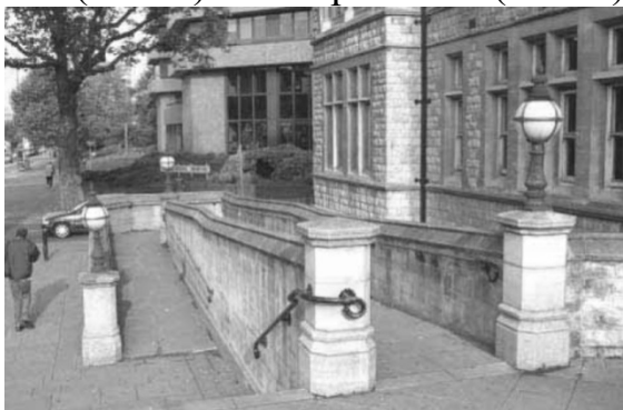
Рис.3.Поворотний пандус. Ealing Town Hall. Великобританія

Пандуси є найбільш поширеним елементом адаптації пам'яток архітектури, тому як можуть використовуватись як інвалідами на візках, так і людьми похилого віку та відвідувачами з дитячими колясками. До того ж, пандуси досить легко поєднуються з історичним контекстом споруди, тому як бувають різних конфігурацій (прямі (Рис. 3), поворотні (Рис. 4), криволінійні) та можуть бути виконані з різних матеріалів (дерево, метал, камінь(Рис. 5), тощо), але зазвичай їх виконують з матеріалів, які відповідають стилю пам'ятки. Там, де влаштування постійного пандусу неможливе влаштовують знімні (Рис. 6) або портативні (Рис. 7) пандуси.