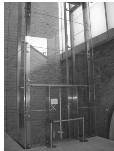
Рис.9. Скляний ліфт в музеї Вікторії та Альберта. Лондон, Великобританія

Там, де неможливо встановити ліфт, або в малоповерхових будівлях і спорудах влаштовують підйомники. Існує декілька їх видів: