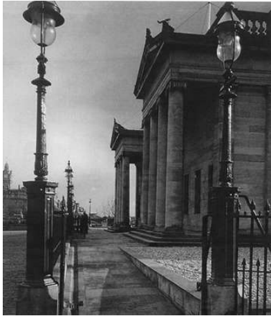
Рис.5. Постійний кам'яний Пандус. Національна галерея Шотландії. Единбург

маршів, або взагалі за її межами (рис. 8). Нерідко зустрічається практика використання прозорих ліфтів (рис. 9), що в великій мірі «розчиняє» ліфт в інтер'єрі, або виконують на контрасті у відмінному від історичної будівлі сучасному стилі (рис. 10). Також існує практика виконання ліфтів в стилі історичної будівлі (рис. 11).