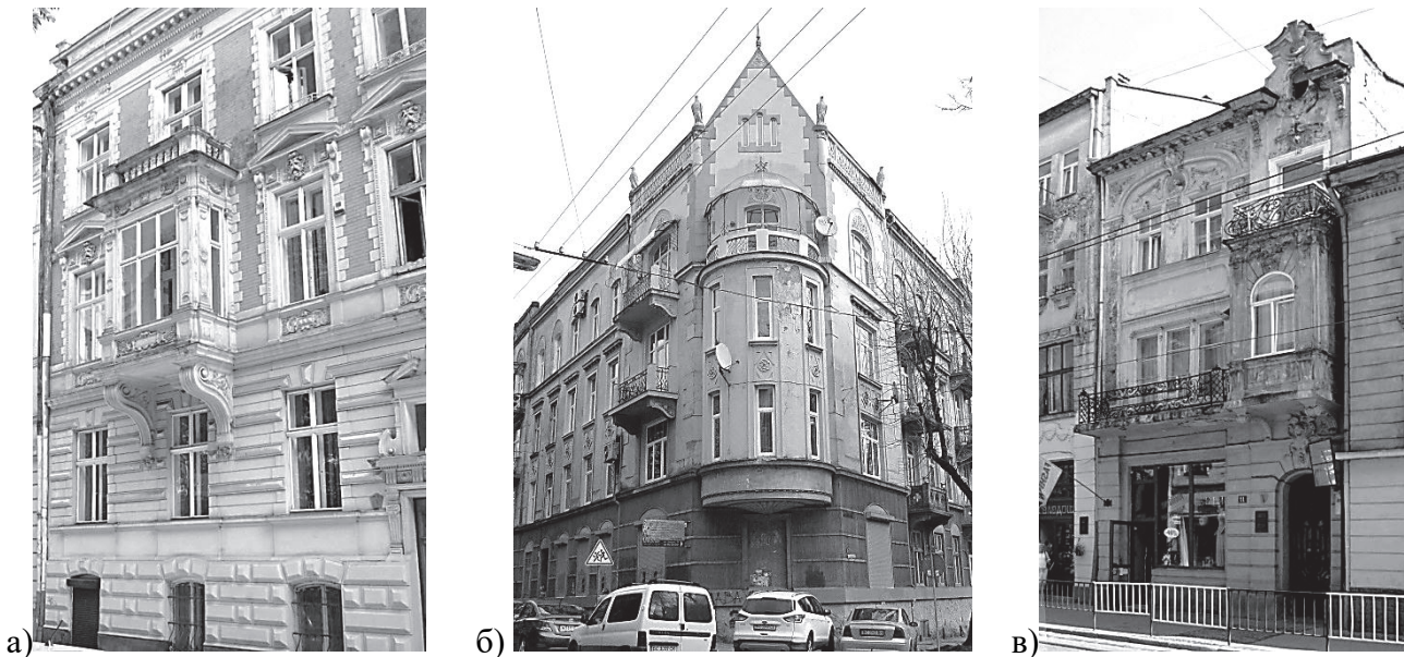
Рис. 1. Балкони, які розташовані над еркерами: а) вул. Рилєєва, 9; б) вул. Японська, 18; в) вул. Дорошенка, 11.

У Львові часто у вирішенні фасадів використовували лише один балкон, розміщений на рівні другого або третього поверхів переважно на центральній осі фасаду. Архітектори часто розташовували балкони на фасаді групами, щоб виділити певну частину композиції. За допомогою балконів також створювали горизонтальне членування фасаду. Нерідко балкон використовували як завершальний елемент еркера (рис. 1). Це характерне для випадків, коли еркер проходив не через усі поверхи будівлі, а також для «маленького» еркера, який влаштовували лише на одному з поверхів (рис. 1а, в). У Львові можна часто побачити поєднання еркеру з балконом над ним із бічними балконами в один архітектурний елемент. За допомогою цього способу архітектори збільшували виразність еркера (рис. 1в).