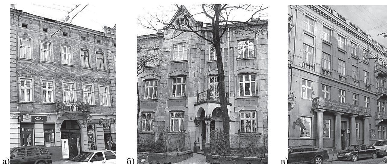
Рис. 3. Балкони, які розташовані над входом або брамою будинку: а) вул. Куліша, 7; б) вул. Котляревського, 19; в) вул. Саксаганського, 5.

Рішення балкона на виступі або карнизі стіни розвивалося разом з балконом над порталом. Цей тип балкона вирішувався у поєднанні з бетонною балюстрадою або металевими огороженням геометричної чи ажурної форми. Балкон з металевою огорожею вирішувався без плити: огорожу монтували безпосередньо на виступ або карниз стіни.