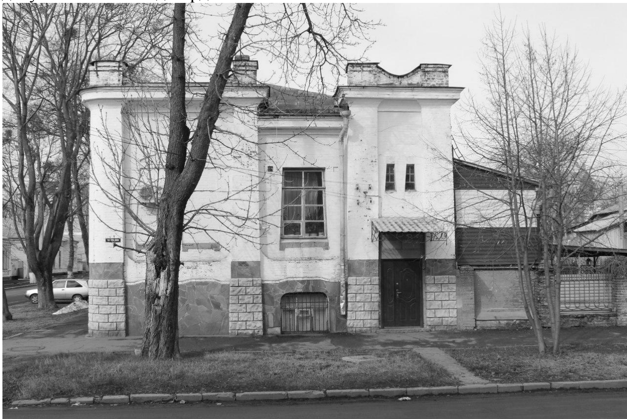
Рис.2. Сучасний стан фасаду будинку по вул. Садовій. Фото А.Ромашко 2016 р.

емігрував і був похований в 1961 році на Ольшанському цвинтарі в Празі. Після Китаю певний час міг будувати в Полтаві, проте ця версія вимагає документального підтвердження.