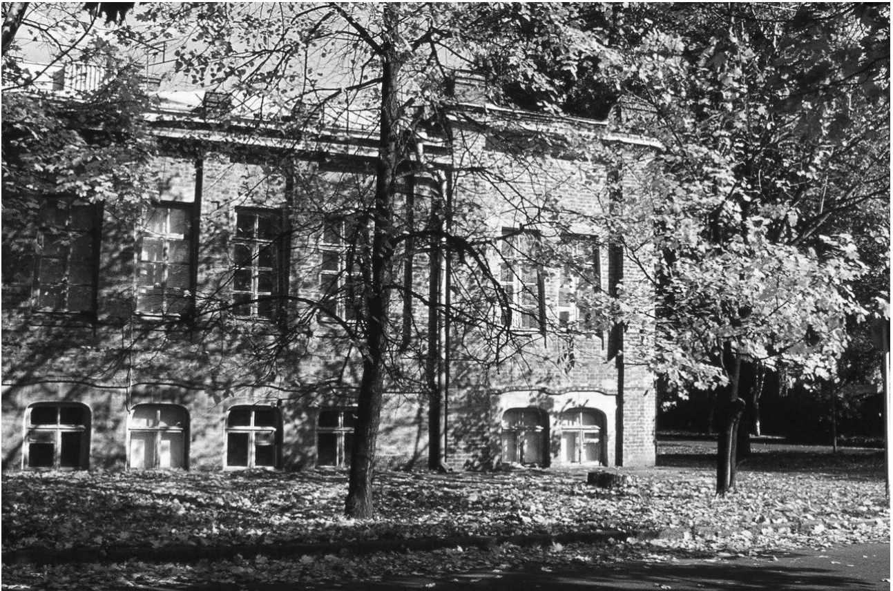
Рис.1. Загальний вигляд будинку в 1980-х рр.

влаштування підлог з дошок, отиньковувались стіни і вкривався залізом дах.