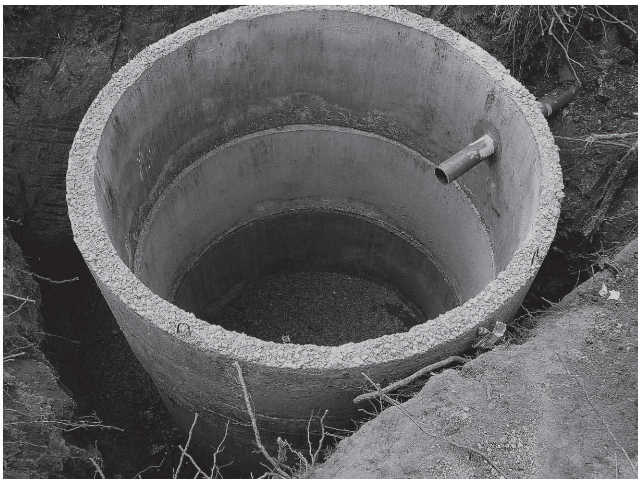
Рис. 5 Дренуюча ємність для зливу води з купелей хрестильень

Хрестильня для дітей розташована над хрестильнею для дорослих, тому для них запроєктована єдина система водопостачання та водовідведення, яка включає постійну фільтрацію води і її видалення в спеціально передбачену підземну закриту дренажну ємність, розташовану з північного боку Собору (рис. 5). Насоси та фільтри розміщуються в сусідньому приміщенні, суміжному з приміщенням камери димовидалення.