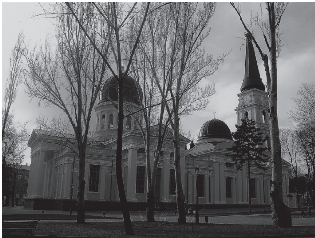
Рис. 1 Відтворений Одеський кафедральний Спасо-Преображенський собор

Одеський кафедральний Спасо-Преображенський собор у 1920-х роках був розграбований і повністю зруйнований у 1936 році, але волею громадян Одеси, на їх кошти, без бюджетного фінансування, відтворений у 1999-2010 роках (рис. 1).