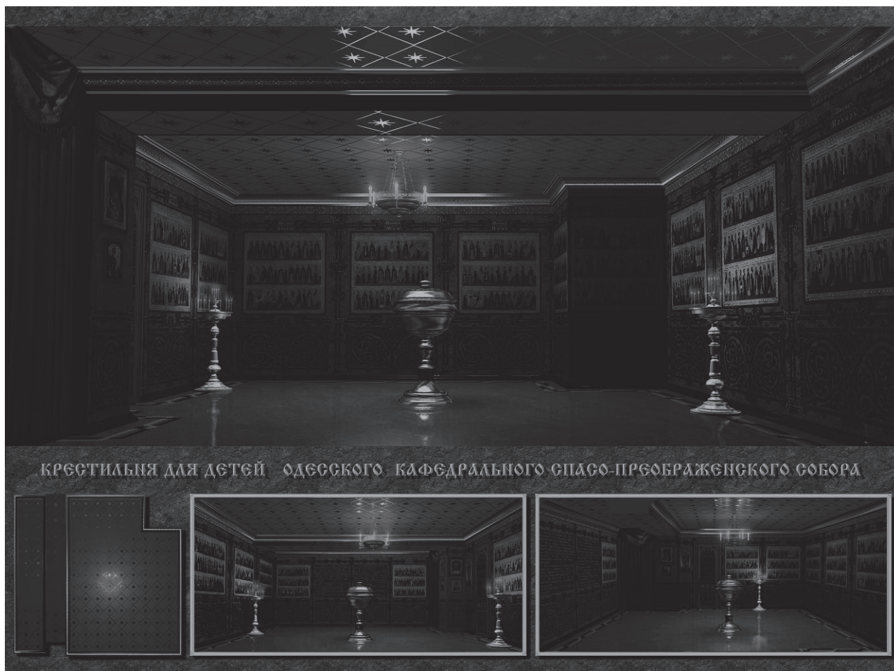
Рис. 3 Вид на західну стіну хрестильні для дітей, проєкт

Проєкт інтер'єру хрестильні для дітей розроблений фахівцями творчої архітектурної майстерні «М-СТУДІО» у 2005 році. На мою думку, це найбільш органічний і вдалий проєкт інтер'єру з усіх, розроблених нами для Одеського кафедрального Спасо-Преображенського собору.