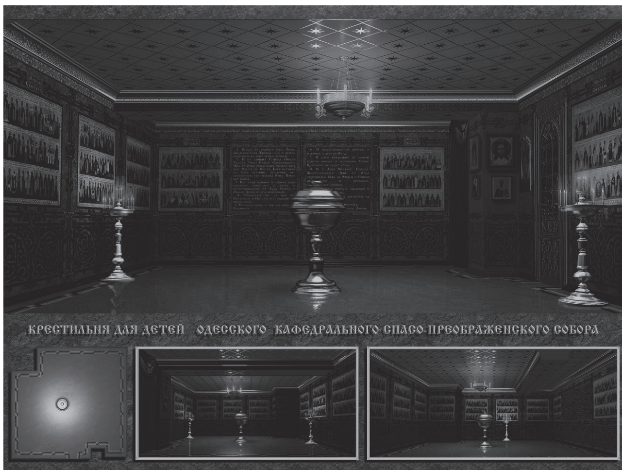
Рис. 2 Вид на східну стіну хрестильні для дітей, проект

У дворівневих приміщеннях Нижнього храму нами були запроєктовані хрестильні для дорослих (на відм. -6.000) і для дітей (на відм. -3.000).