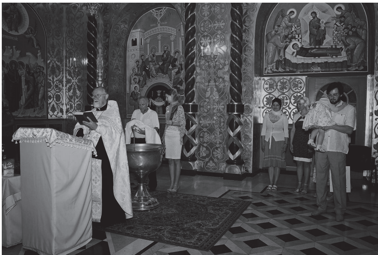
Рис. 7 Хрещення дитини у молитовному залі Нижнього храму

Площина стелі хрестильні (за аналогією з молитовним залом), декорується орнаментом у вигляді золоченої сітки на бежево-охристому фоні (рис. 2, 3). Цей прийом використовується для візуального збільшення висоти хрестильні. Як уже зазначалося, відблиск від палаючих свічок при різному освітленні золоті сітки створює враження переднього плану, при цьому матова бежево-охриста площина стелі стає просторово віддаленою і формує другий план. На стелі розміщується панікаділо.