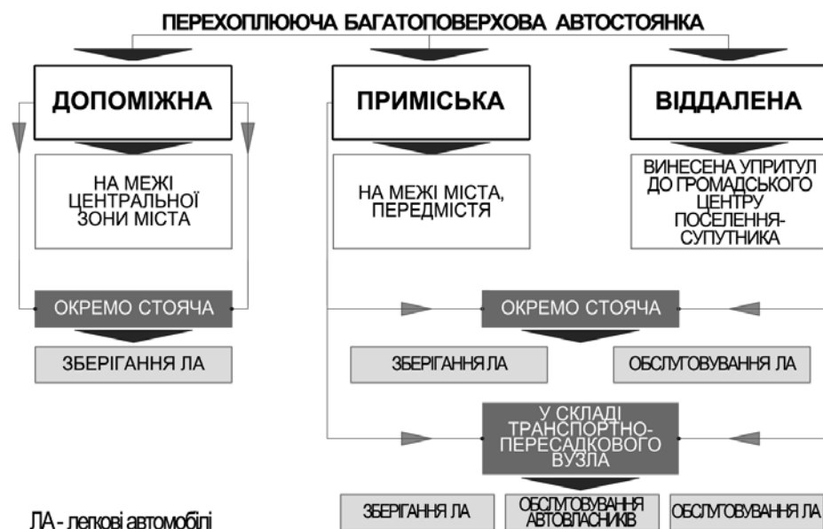
Рис. 1. Класифікація перехоплюючих автостоянок за розміщенням у структурі міста

Висновок. На підставі проведених досліджень вже існуючого міжнародного досвіду та отриманих результатів були сформульовані практичні рекомендації з розміщення ПАБ в транспортно-пересадочних вузлах НМ з радіально-кільцевим плануванням.