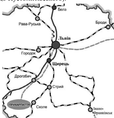
Рис. 1. Розташування Щирця у мережі шляхів.

Впродовж XX ст. населення містечка зростало, процес прискорився у другій половині XX ст. (радянський період) і досягло у 2000 р. 5,9 тис. осіб [6]. За радянських часів Щирець деякий час (1939 – 1941, 1944 - 1959) виконував функції районного центру (у 1959 р. територію Щирецького району приєднали до Пустомитівського).