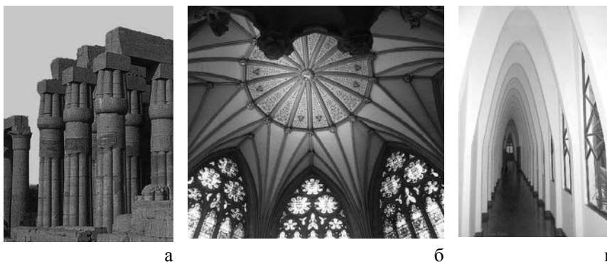
Рис. 1 Просторово-конструктивна графіка історичного інтер'єру: а - Стародавній Єгипет. Храм Амона. XV-XVIII ст. до н.е.; б - Склепіння собору у Вінчестері; в - Інтер'єр школи монастиря св. Терези (арх. А. Гауді)

шпалери; керамічна плитка; текстиль; декоративне тинькування. За темою зображення: орнамент; абстракція; панорама; сюжет; текст.