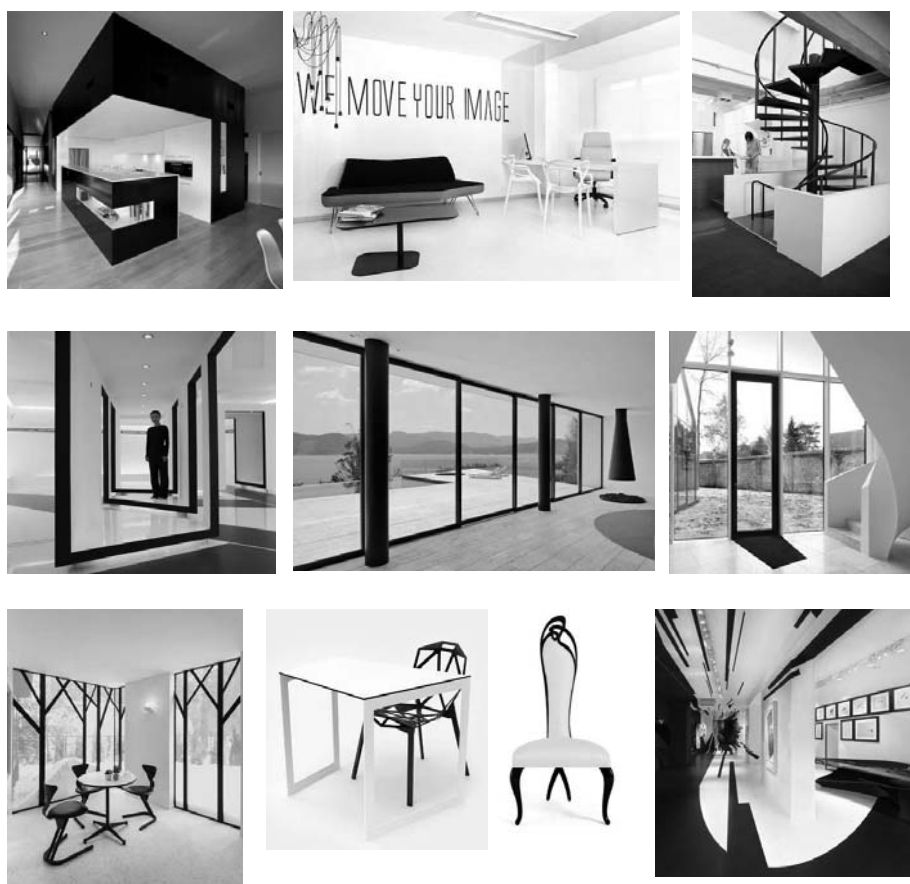
Рис. 3 Приклади «графічного» інтер'єру

Застосування графіки при формуванні інтер'єрів житлових і громадських будівель допомагає організувати архітектурний простір, конкретизувати ідею оформлення, створити і підсилити певну емоційну ідею і є одним із ефективних засобів створення індивідуального характеру та художнього образу інтер'єру.