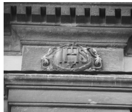
Рис.6. Христограма «IHS» емблема ордену єзуїтів.

Ще одну емблему єзуїтів зображено на одній з каплиць Латинської катедрі на пл. Катедральній 1, так званої каплиці Вишневецьких чи Бучацьких, або Найсвятішого Сакраменту (рис. 7). На цьому місці від 1440 року знаходилась каплиця Бучацьких, перебудована архієпископом Я. Д. Соліковським у 1587 р. У цьому ж році архієпископ запросив товариство до міста і надав для їхнього внутрішнього використання саме цю каплицю. Північна стіна каплиці має два вікна. Між вікнами уміщено таблицю з рельєфними літерами «IHS» емблемою єзуїтів (рис. 8). Каплиця Бучацьких або Вишневецьких була першим пристанищем єзуїтів у Львові [1, 5].