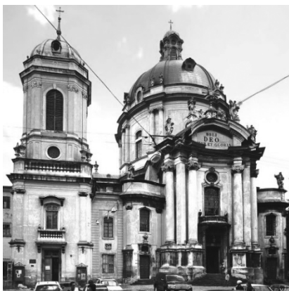
Рис.1. Домініканський собор. Вул. Музейна 3.

Перші чернечі згромадження які прийшли на Українські землі були францисканці та домініканці. Коли домініканці прийшли до Львова у 1749 році вони заклали фундамент собору, за сучасною адресою вул. Музейна 3, проект виконав Ян де Вітте (рис. 1). Традиційним символом домініканського ордену був чорний із білими плямами собака, що тримав у зубах палаючий факел – вогонь істини. Цей образ виник завдяки грі латинських слів: монахів часто називали домініканцями (лат. Dominicanses), що означало послідовники Домініка; однак їхню назву можна перекласти і як «пси Господні» (рис. 3). Емблему ордену домініканців можна побачити на пряслі стіни між дзвіницею та собором (рис. 2). [1, 2]