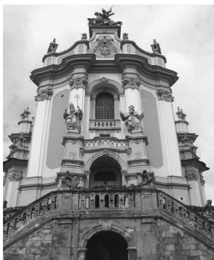
Рис.15. Церква св. Юра.