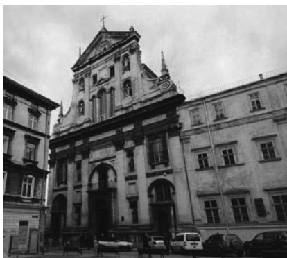
Рис.4. Церква св. ап. Петра і Павла.

скорочення теж по різному (рис. 6). Христограма «IHS» – це перші три літери «ΙΗΣΟΥΣ», які вимовляються грецькою мовою як «Ісус». Цей надпис використовувався як емблема ордену єзуїтів [3, 5].