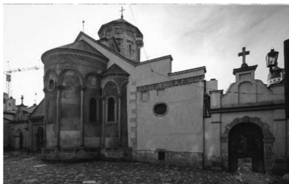
Рис.28. Вірменська церква.

Пресвятої Богородиці (рис. 28). За час свого існування собор зазнав багато змін, добудов і перебудов. У подвір'ї церкви над брамою яка веде до захристії, на замковому камені порталу зображено герб Костеша (рис. 29, 30). Герб розміщений у бароковому картуші із завитками і зображає на червоному полі стрілу, направлену вгору і перехрещену посередині, з роздвоєним кінцем. [7]