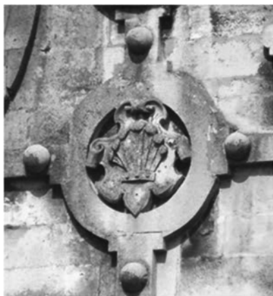
Рис.22. Герб Єжи Мнішика. Фото автора.