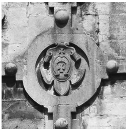
Рис.23. Герб Любич Станіслава Жолкевського.