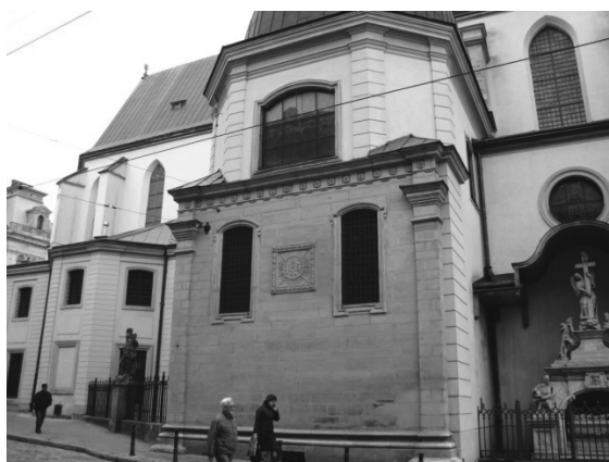
Рис.7. Каплиця Вишневецьких-Бучацьких. Фото автора.

Ще одну емблему єзуїтів зображено на одній з каплиць Латинської катедрі на пл. Катедральній 1, так званої каплиці Вишневецьких чи Бучацьких, або Найсвятішого Сакраменту (рис. 7). На цьому місці від 1440 року знаходилась каплиця Бучацьких, перебудована архієпископом Я. Д. Соліковським у 1587 р. У цьому ж році архієпископ запросив товариство до міста і надав для їхнього внутрішнього використання саме цю каплицю. Північна стіна каплиці має два вікна. Між вікнами уміщено таблицю з рельєфними літерами «IHS» емблемою єзуїтів (рис. 8). Каплиця Бучацьких або Вишневецьких була першим пристанищем єзуїтів у Львові [1, 5].