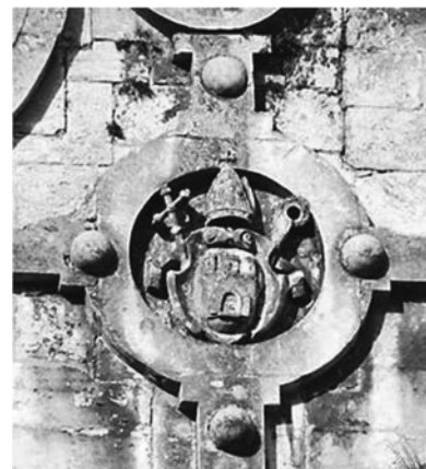
Рис.24. Герб Львова.

Церкву Пресвятої трійці або сестер сакраменток за адресою вул. Тершаківців 11, почали будувати у 1739 р. за проектом Бернарда Меретина (рис. 25). Сучасного вигляду будівля набула після перебудови у 1881–1887 рр. за проектом Адольфа Мінаевича. Церква сестер сакраменток збудована у бароковому стилі. В основі будівлі закладена традиційна в Європі тринавна базиліка з видовженим вівтарем, двома захристіями та вежею. Над головним входом розміщений рельєф Всевидяче око (рис. 26, 27). В християнській традиції цей символ трактується як Око Господа, що споглядає за світом, а також як символ Божого Провидіння. Часто він вписаний у трикутник, що є символом Святої Трійці. Також навколо трикутника іноді зображають сяйво, що символізує неприступну славу. В християнській архітектурі цей символ поширюється – у західній Європі у XVII-XVIII ст., а у Східній – з кінця XVIII ст., як купольне зображення у храмах [4].