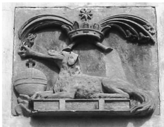
Рис.3. Емблема ордену домініканців.

Орден єзуїтів з'явився у Львові в 1584 році. Костел св. ап. Петра і Павла побудовано протягом 1610-1630 рр. італійським архітектором єзуїтського ордену Джакомо Бріано теперішня адреса вул. Театральна 11 (рис. 4). Домінуючим є головний фасад, оздоблений пілястрами коринфського ордену, нішами зі статуями святих та орнаментальною різьбою віконних обрамлень. У фронтоні фасаду є барельєф вівці з прапором це символ під назвою Агнець Божий (рис. 5). Агнець Божий (Agnus Dei) – це одне з імен Ісуса Христа в Новому Завіті. Цей символ відноситься до емблеми ордену єзуїтів. Він використовується, щоб вказати на роль Христа як агнця (ягняти), принесеного в жертву для спокутування гріхів світу. Його зображують з німбом навколо голови і з прапором, на якому зображений червоний хрест на білому тлі, що символізує воскресіння.