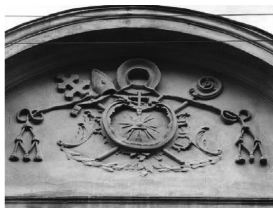
Рис.32. Герб вірменських архієпископів.

Після дослідження церковного геральдичного декору, герби можна розділити на три категорії. Перша це за тематикою, друга за композиційним оформленням, третя за розміщенням на фасаді. За тематикою герби поділяються