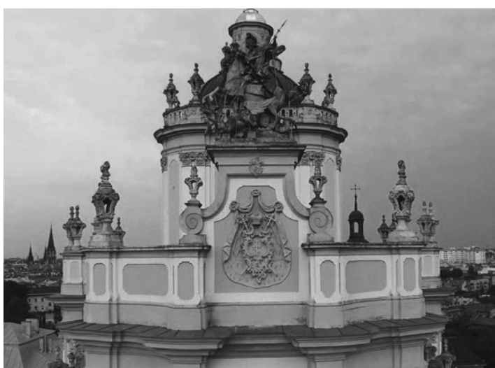
Рис.16. Герб на фронтоні.

Палац греко-католицьких митрополитів побудовано у 1761-1762 роках, архітектор Клеменс Фесінгер у стилі пізнього бароко з елементами класицизму (рис. 17). Будівля, розміщена у подвір'ї проти собору св. Юра. Центральний ризаліт будівлі оформлений портиком і завершений фронтоном з гербом Шептицьких у тимпані. Герб Шептицьких Побуг це один з небагатьох прикладів особової церковної геральдики у Львові. Геральдична фігура розміщена на мантиї та увінчана митрою з посохом та хрестом (рис. 18). [3, 6].