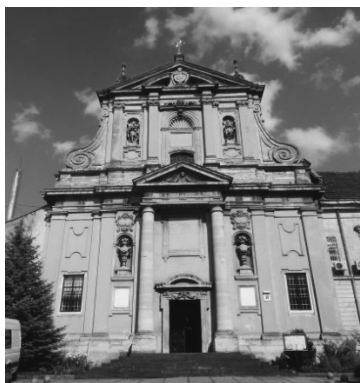
Рис.9. Церква Стрігенья Господнього.

9). Період будівництва охоплює 1642 – 1644 рр., архітектор – Д. Б. Джізеліні. Архітектура храму наслідує модель церкви Сан-Сусанна в Римі і є виразним свідченням впливів римського бароко. Фасад двоярусний з фронтоном та широким фризом. На фронтоні фасаду у круглому розірваному сандрику розміщений картуш з гербами (рис. 10). У лівій частині картуша зображено герб роду Собеських Яніна – в червоному полі знаходиться щит меншого розміру. У правій частині картуша зображений герб Даниловичів Сас в блакитному полі золотий півмісяць, обернений ріжками вгору, над ним, між двома золотими зірками – срібна стріла, скерована гострим кінцем угору (рис. 11). [4]