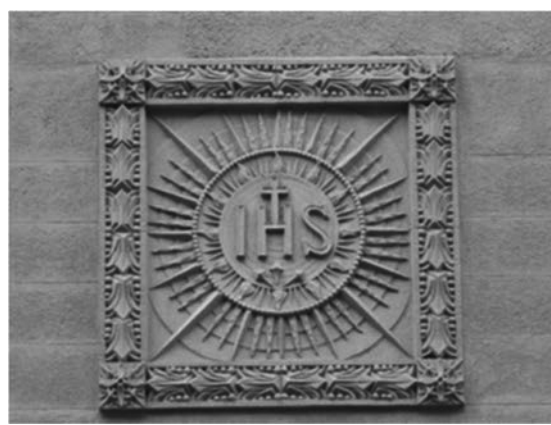
Рис.8. Емблема ордену єзуїтів.

Церква Стрітєння Господнього споруджена на пагорбі на вул. В. Винниченка 30а, з півдня до нього прилягають келії колишнього монастиря (рис.