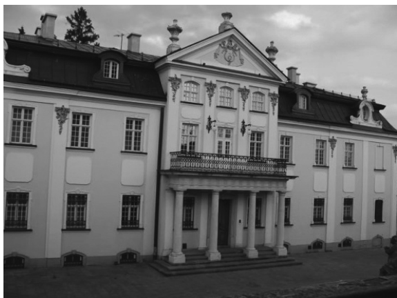
Рис.17. Палац греко-католицьких митрополитів.