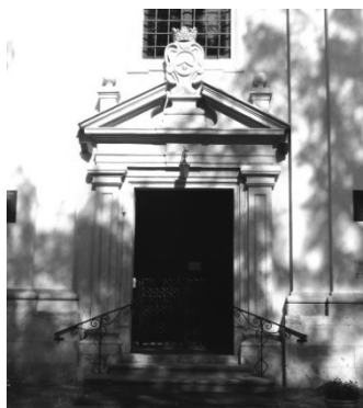
Рис.13. Портал увінчаний гербом.