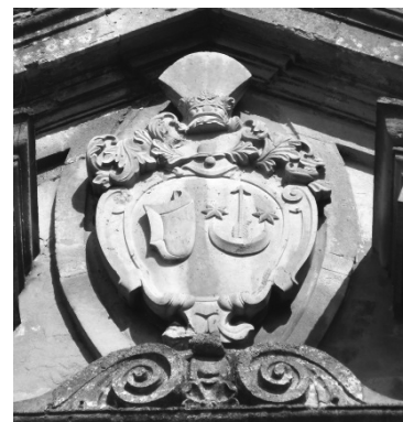
Рис.11. Герби Яніна та Сас.

Колишній костел кармелітів босих, тепер церква св. Михаїла на вул. Винниченка 22 споруджено у XVII ст. за межами давніх міських мурів, на пагорбі (рис. 12). Разом з будівлями келій та оборонною стіною, храм творить єдиний архітектурний комплекс, що протягом XVII-XVIII ст. мав оборонне значення. Фасад костелу почленований пілястрами і оздоблений скульптурами святих. Над головним входом до храму розташована геральдична композиція – емблема ордену кармелітів босих (рис. 13). Герб складається зі щита та корони над ним. Герб зображає гору Кармель загострена верхівка якої ділить гербовий щит на три частини. Кожна частина прикрашена зіркою: середня зірка символізує Марію, дві з боків – пророків (рис. 14). Гербова фігура над порталом є спотвореною. Із трьох зірок залишилась тільки одна, нижня, а гора майже повністю деформована [4, 5].