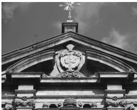
Рис.10. Фронтон з гербом.