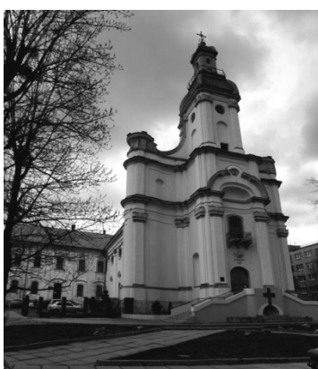
Рис.25. Церква Пресвятої тріїці.

Церкву Пресвятої трійці або сестер сакраменток за адресою вул. Тершаківців 11, почали будувати у 1739 р. за проектом Бернарда Меретина (рис. 25). Сучасного вигляду будівля набула після перебудови у 1881–1887 рр. за проектом Адольфа Мінаевича. Церква сестер сакраменток збудована у бароковому стилі. В основі будівлі закладена традиційна в Європі тринавна базиліка з видовженим вівтарем, двома захристіями та вежею. Над головним входом розміщений рельєф Всевидяче око (рис. 26, 27). В християнській традиції цей символ трактується як Око Господа, що споглядає за світом, а також як символ Божого Провидіння. Часто він вписаний у трикутник, що є символом Святої Трійці. Також навколо трикутника іноді зображають сяйво, що символізує неприступну славу. В християнській архітектурі цей символ поширюється – у західній Європі у XVII-XVIII ст., а у Східній – з кінця XVIII ст., як купольне зображення у храмах [4].