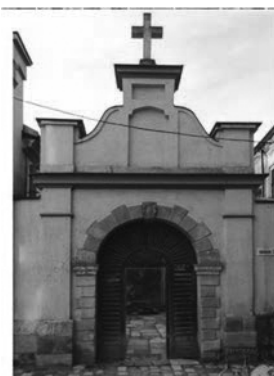
Рис.29. Брама до завхристії.