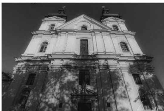
Рис.12. Церква св. Михаїла.

увінчана митрою, посох і хрест розміщуються за щитом навскіс, на щиті зображено хрест з поперечною перекладиною.