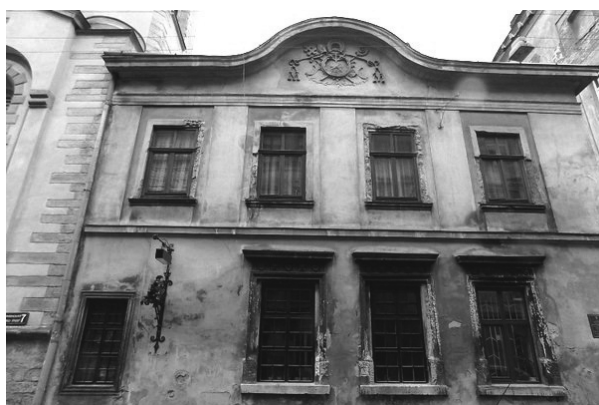
Рис.31. Палацом вірменських архієпископів.

Зі сходу подвір'я ансамблю Вірменської церкви замикається Палацом вірменських архієпископів, зведеним наприкінці XVII століття архієпископом Гунаніяном (рис. 31). Після пожежі 1778 року споруду відбудував і розширив один з його наступників – Я. Августинович. На щипці будівлі зображено герб вірменських архієпископів – на мантиї зображено Всевидяче око посох і хрес розміщені за мантиєю і увінчані напкою кардинала із зав'язками які звисають по обидва боки герба (рис. 32). [3, 7]