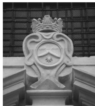
Рис.14. Емблема кармелітів босих.