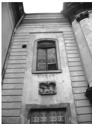
Рис.2. Емблема на пряслі стіни.