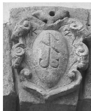
Рис.30. Герб Костеша.

Зі сходу подвір'я ансамблю Вірменської церкви замикається Палацом вірменських архієпископів, зведеним наприкінці XVII століття архієпископом Гунаніяном (рис. 31). Після пожежі 1778 року споруду відбудував і розширив один з його наступників – Я. Августинович. На щипці будівлі зображено герб вірменських архієпископів – на мантиї зображено Всевидяче око посох і хрес розміщені за мантиєю і увінчані напкою кардинала із зав'язками які звисають по обидва боки герба (рис. 32). [3, 7]