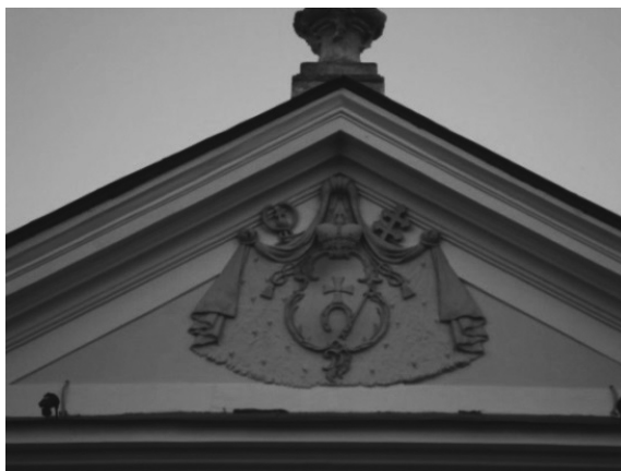
Рис.18. Родовий герб графів Шептицьких на фронтоні митрополичого палацу при соборі святого Юра у Львові.