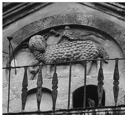
Рис.5. Барельєф вівці - Агнець божий.