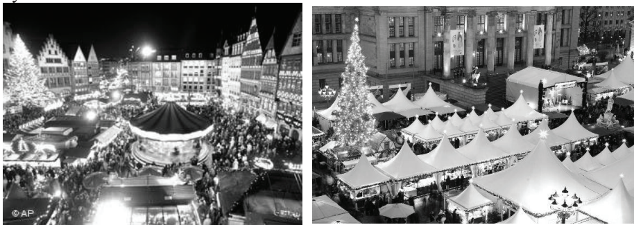
Рис.1. Щорічний різдвяний ярмарок у Франкфурті-на-Майні (а). у Берліні (б), Німеччина.

Інший аспект організації середовища для проведення святкових заходів в містах пов'язаний з періодичними потребами міст при проведенні національних свят, періодичних ярмарок та фестивалів, при організації святкової торгівлі або сезонному розширенні торгівлі, що проводиться через певні визначені періоди часу.