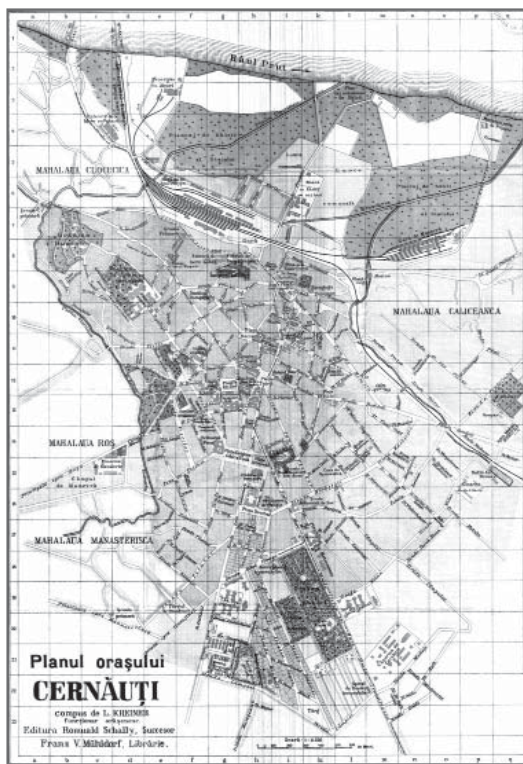
Карта города. Cernăuți 1920.