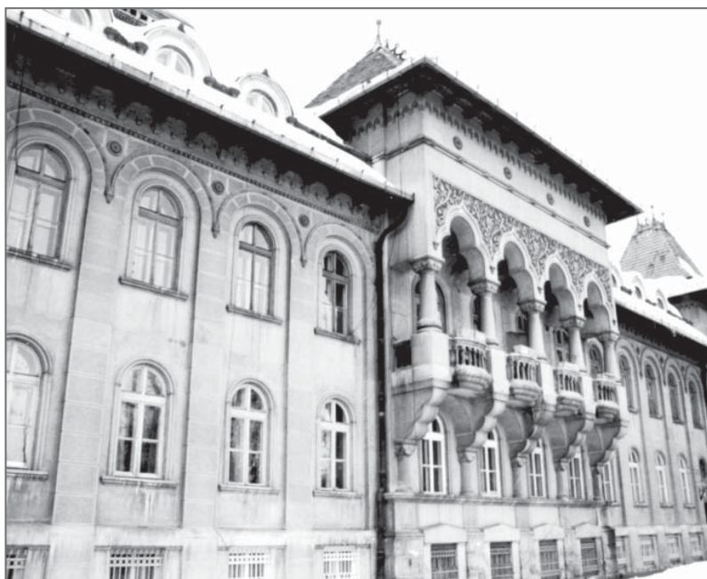
Жилой дом по ул. Университетской в стиле необрынковяну.

Интересным примером уплотнения жилой застройки города стало соединение озеленённых пространств в середине кварталов, которые остались незаполненными со времён «австрийского» периода. Оно достигалось образованием новых переулков-проездов, ведущих в глубину кварталов. Таких примеров в городе – немало. Один из наиболее интересных – ансамбль жилых домов по ул. Н. Кордубы (в вестибюлях домов, на полу, чудом сохранились даже даты постройки домов).