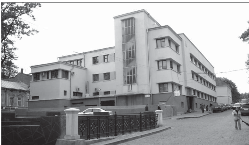
Здание, занимаемое сейчас городской поликлиникой на ул. Школьной в стиле европейского функционализма.

Как было отмечено в статье О. Повстенко, художественно-эстетический образ городской застройки, в румынский период значительно изменился. Версальский мир 1918 года перекроил политическую карту Европы. Черновцы, как столица Буковины, были переданы в состав Румынского государства и находились под его эгидой до весны 1940 года. Невзирая на политические изменения в жизни города, в 1920-1930-х годах в городе был заметен активный рост населения [17], поэтому Буковинская столица в этот период стала быстро застраиваться. Появились новые кварталы вилловой застройки на современных улицах Ю. Федьковича и Фрунзе. Высокий уровень архитектурных решений большинства зданий этого района сделали его важным, с точки зрения сохранности традиционного характера городской среды. В это же время были построены Дворец короля Михая (Культурный центр Румынского народного Дома, по проекту Х. Крянгэ) [18], дома социального обеспечения,