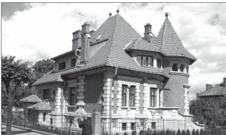
Частная вилла в стиле румынизированного арт-деко

Как было отмечено в статье О. Повстенко, художественно-эстетический образ городской застройки, в румынский период значительно изменился. Версальский мир 1918 года перекроил политическую карту Европы. Черновцы, как столица Буковины, были переданы в состав Румынского государства и находились под его эгидой до весны 1940 года. Невзирая на политические изменения в жизни города, в 1920-1930-х годах в городе был заметен активный рост населения [17], поэтому Буковинская столица в этот период стала быстро застраиваться. Появились новые кварталы вилловой застройки на современных улицах Ю. Федьковича и Фрунзе. Высокий уровень архитектурных решений большинства зданий этого района сделали его важным, с точки зрения сохранности традиционного характера городской среды. В это же время были построены Дворец короля Михая (Культурный центр Румынского народного Дома, по проекту Х. Крянгэ) [18], дома социального обеспечения,