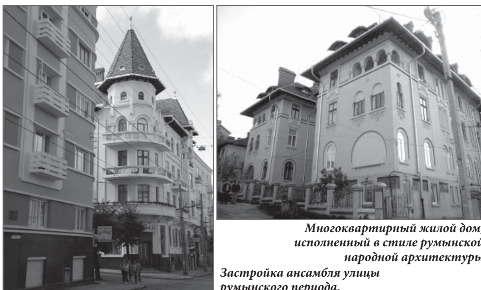
Многоквартирный жилой дом, исполненный в стиле румынской народной архитектуры

поликлиники на современной ул. Л. Украинки, бурсы им. Нистора, Николаевская, Михайловская и Петропавловская церкви, кварталы 4-5 этажных кооперативных жилых домов. И, безусловно, в стилистике застройки города, с оглядкой на идеологические предпосылки, стали господствовать стили «неороманеск», «необрынкавяну», наряду с европейскими арт-деко и функционализмом. Однако румынские власти не вносили заметных изменений в градостроительный облик города [19], за исключением внедрения политики «румынизации» внешнего облика города методом переименования улиц, рекламы и оформления витрин. Эти события ярко отображены в различных фотографиях и листовках 1920-1930-х годов, этажей нескольких зданий с «необрынкавяновским» фасадным декором и партерное углубление в планировке площади [20].