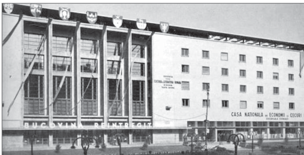
Здание Румынского Дворца Культуры арх. Х. Крянгэ. 1937 год.

Но несмотря на высокий уровень сохранности ансамблевой целостности архитектурного наследия в городе, от военных действий Второй Мировой Войны, по сообщениям местных газет того времени (в обращении первого секретаря С. Дидыка к горожанам) указывалось, что «[...] полностью уничтожено 304 жилых домов, площадью в 20 тыс. кв. метров. Полуразрушено около 455 зданий, площадью в 14 тыс. кв. метров». Только в самом центре города, в районе современных улиц Почтовой и Центральной площади, были «сожжены и подорваны 13 жилых домов, телефонная станция, Мраморный зал бывшей резиденции [...], разрушены два моста через реку Прут, вывезено 20 автобусов, по 25 мест каждый, 7 троллейбусных вагонов из восьми, что были до войны» [24]. Также сообщалось, что «[...] за день до входа советских войск, в городе подожгли резиденцию, [...] в мавританско-византийском стиле, созданную из местных материалов, буковинскими мастерами [...]. Все