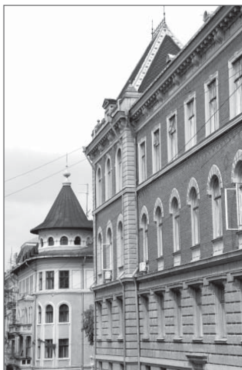
Фрагмент ансамбля уличной застройки с австрийско-румынской застройкой.

Об архитектуре межвоенного периода XX века известно очень мало. Многие архивные материалы в военные годы были вывезены в разные страны мира, оставаясь на протяжении многих десятилетий в полном забвении. Бесценным источником об архитектуре города того периода долгое время оставалась лишь статья директора Национального Заповедника «София Киевская», известного украинского искусствоведа Алексея Ивановича Повстенко (1902–1973), напечатанная в 1940 году, в советском журнале «Архитектура советской Украины»: «На высоком правом берегу Прута раскинулись Черновцы - живописнейший город зелёной Северной Буковины [...]. Он отличается своей живой торговлей, какой может состязаться с Бухарестом; своими магазинами, люкс-ресторанами, кафе [...], аристократическими кварталами с роскошными вилами и гостиницами.» [16].