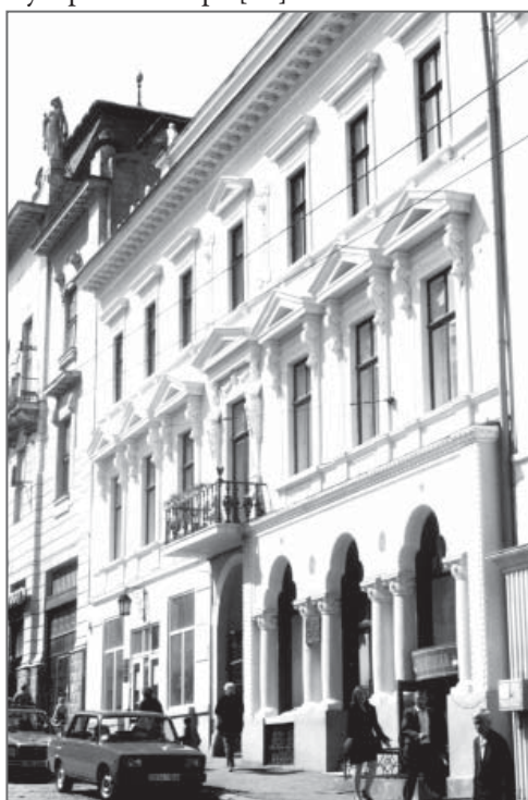
Фасад здания с австрийско-румынским архитектурным декором.

Учёным стали доступны неизвестные до сих пор материалы, что хранятся в архивных фондах государственных и частных учреждений зарубежных стран, в частности Венского Государственного Архива; Научной Библиотеки Архитектурного Центра Вены (AzW); Государственной Академии Изобразительных Искусств Вены; Австрийского частного Фонда Фредерика и Лилиан Кизлер и др. Здесь обнаружен целый ряд неизвестных фактов из истории развития черновицкой архитектуры, что привело к появлению совершенно новых публикаций о неизвестных архитекторах, которые рождены в Черновцах или проектировали в этом городе. В киевском научно-исследовательском журнале, 2011 года, была напечатана статья о малоизвестном черновицком периоде жизни выдающегося венского архитектора Хуберта Гесснера [15].